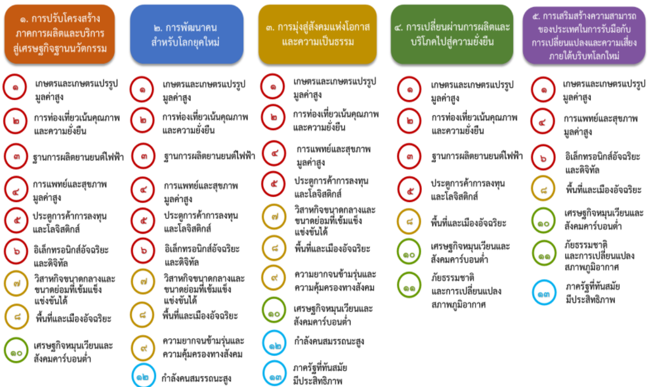
แผนภาพที่ ๓.๑ ความเชื่อมโยงระหว่างหมวดหมู่การพัฒนากับเป้าหมายหลัก

ความเชื่อมโยงระหว่างหมวดหมู่การพัฒนากับเป้าหมายหลักแสดงไว้ในแผนภาพที่ ๓.๑ โดยหมวดหมู่การพัฒนากำหนดขึ้นเป็นประเด็นที่มีลักษณะเชิงบูรณาการที่ครอบคลุมการพัฒนาตั้งแต่ใน ระดับต้นน้ำจนถึงปลายน้ำ และสามารถนำไปสู่ผลพัฒนาทั้งในมิติเศรษฐกิจ สังคม ทรัพยากรธรรมชาติและ สิ่งแวดล้อมไปพร้อมๆ กัน ทำให้หมวดหมู่แต่ละประการสามารถสนับสนุนเป้าหมายหลักได้มากกว่าหนึ่งข้อ นอกจากนี้การพัฒนากายใต้แต่ละหมวดหมู่ไม่ได้แยกขาดจากกัน แต่มีการสนับสนุนหรือเอื้อประโยชน์ซึ่งกัน และกัน